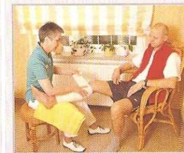
Versorgung nach einem Unfall

z.B. Arztbesuche, Medikamentenhol- und Bringdienste, Essen auf Rädern, Fahrdienste, Behördengänge, Einkäufe, Friseur, Vorlesen, Spaziergänge und Gespräche, Vermittlung von Hausnotruf-Diensten. Palliativversorgung.