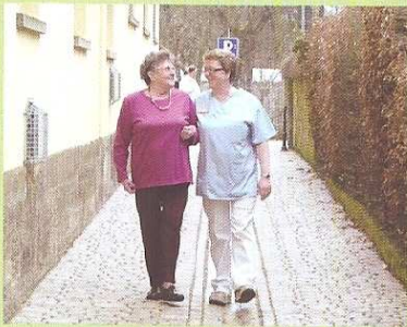
Spaziergang und Gespräche

Julius-Ambulanter Pflegedienst Münnerstadt