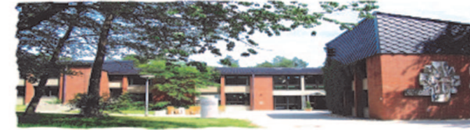
Kath. Landvolkshochschule Feuerstein