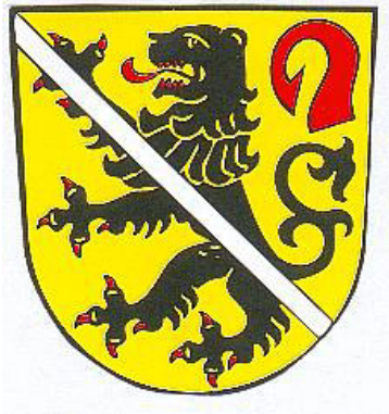
Stadt Zeil a.Main